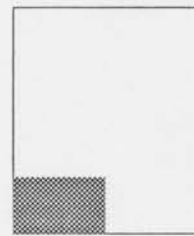
1/8 oldal fekete-fehér 15 000 Ft

Két színnel nyomtatott hirdetés esetén: fekete-fehér alapár + 13 000 Ft + ÁFA A folyóirat mellé borítékolt hirdetés esetén laponként 32 000 Ft + ÁFA