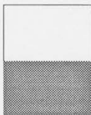
1/2 oldal fekete-fehér 50 000 Ft 1/2 oldal színes 100 000 Ft