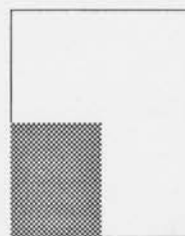
1/4 oldal fekete-fehér 29 000 Ft